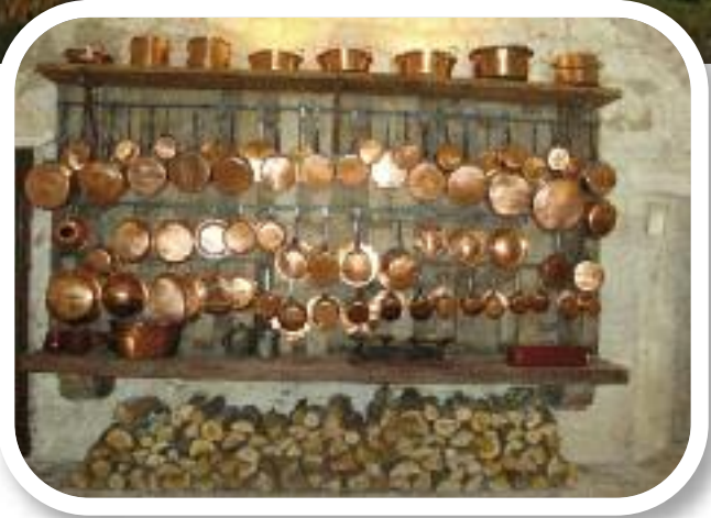
Cuisine du Château de Bridoire

www.ecomusee-truffe-sorges.com – www.foiegras-perigord.com