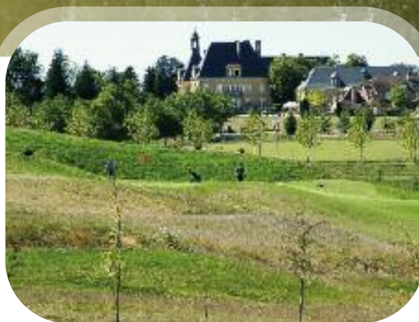
Essendieras – Hole 5