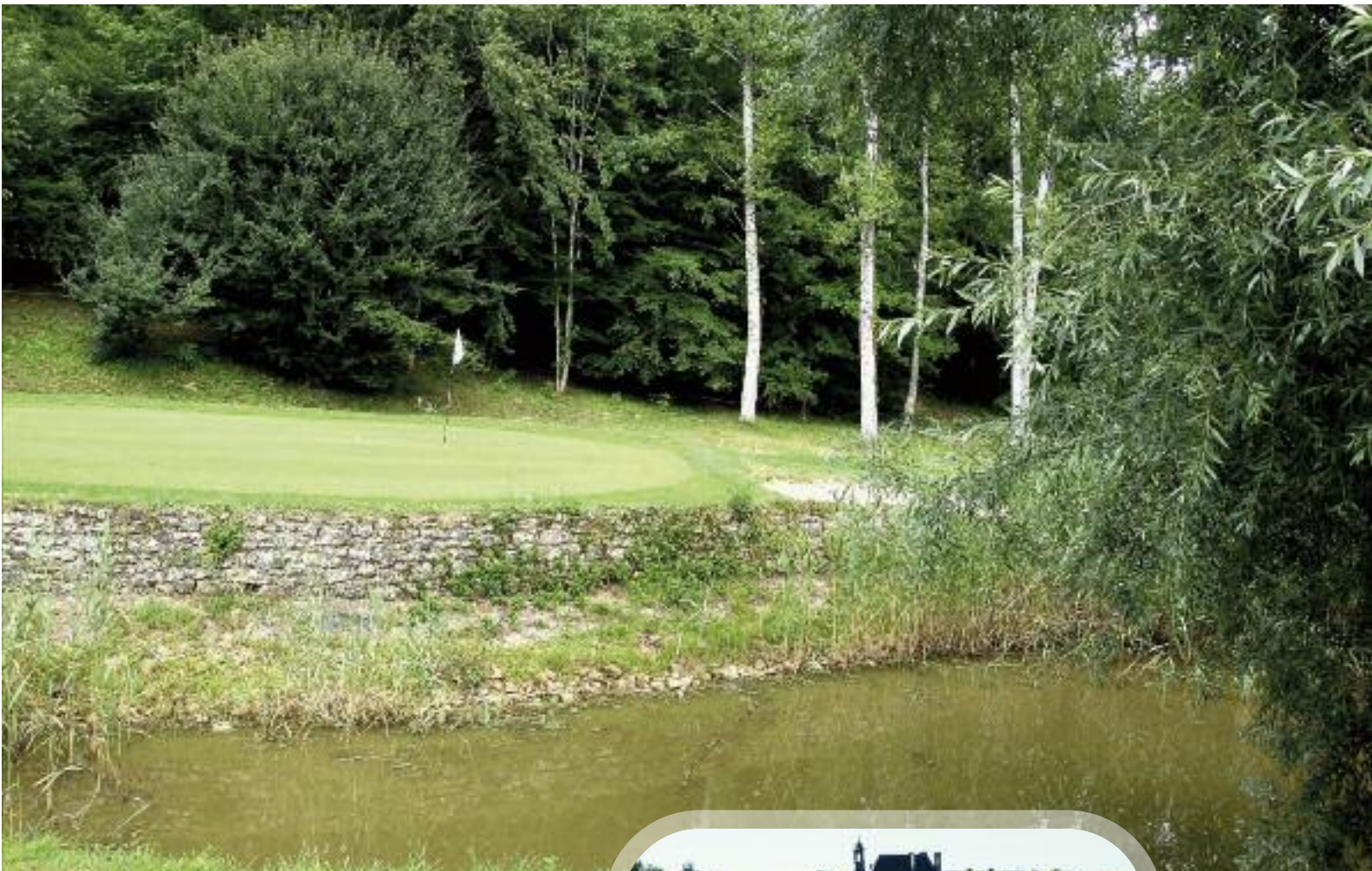
Golf du Château Les Merles