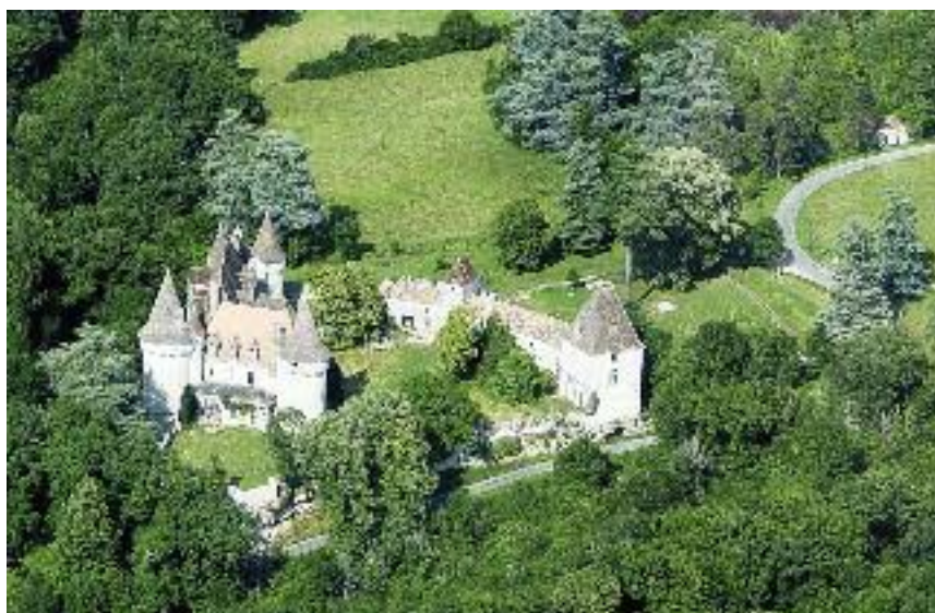
Château de Bridoire

Julien Prévot, le dynamique directeur du golf, dirige de main de maître un des parcours les plus fréquentés de la région ainsi que son école, et organise des stages réguliers pour les jeunes. Le Clubhouse, adossé au restaurant, propose une formule « Lolivarie Golf Pass » à 60 € : green fee + menu golfeur (plat-dessert-vin-café) inclus, qui connaît un grand succès.