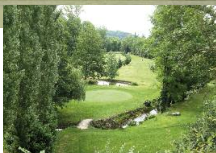
Golf de la Forge