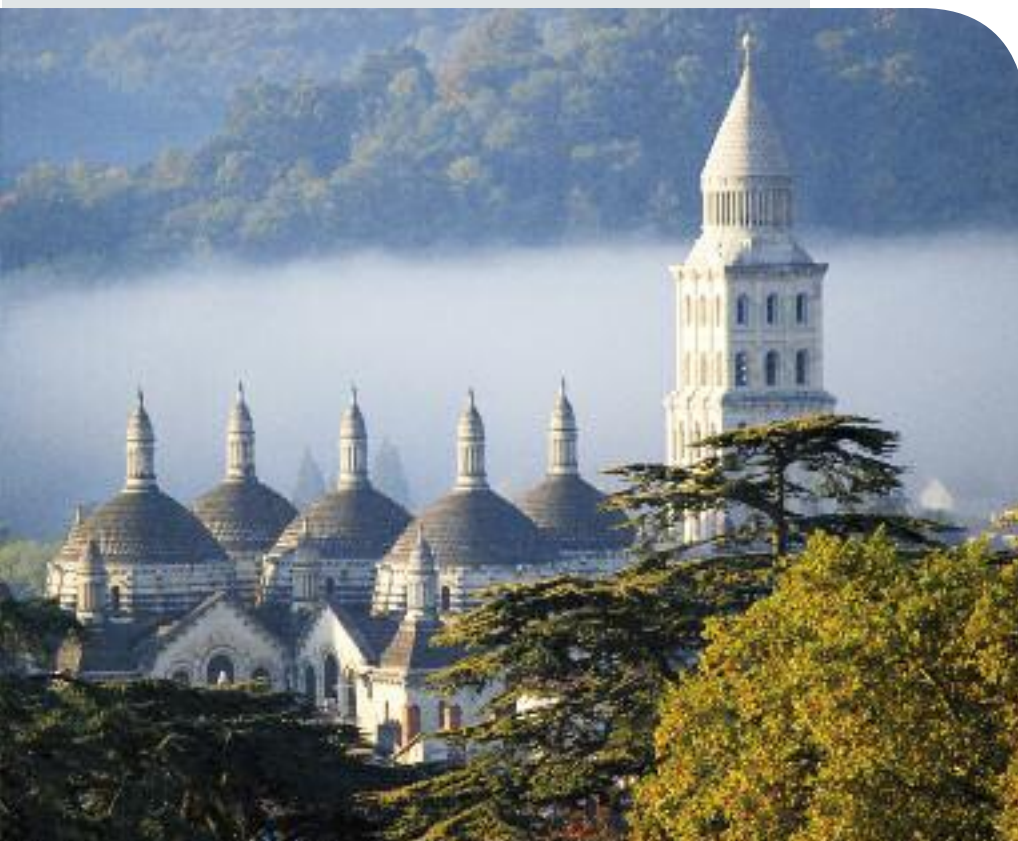
Cathédrale de Périgueux